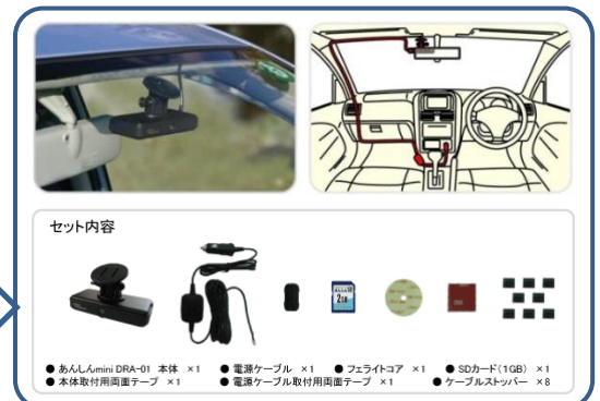
ドライブレコーダーあんしんminiセット内容